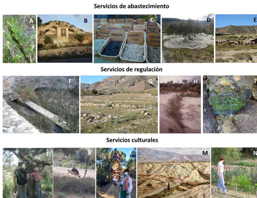
Figura 3. Algunos ejemplos de beneficios coproducidos en el socioecosistema de los ríos secos. A. Alimentos; B. Agua; C. Medicinas naturales; D. Cultivos de secano; E. Ganadería trashumante; F. regulación hídrica; G. Control de la erosión; H. Minimización de las avenidas de agua; I. Recarga del subálveo; J. Sentido de pertenencia; K. Relajación; L. Identidad cultural; M. Inspiración; N. Ocio y recreo. Some examples of benefits co-produced in the dry river socio-ecosystem. A. Food; B. Water; C. Natural medicines; D. Rainfed crops; E. Transhumant livestock; F. Water regulation; G. Erosion control; H. Minimisation of water floods; I. Recharge of sub-alveo; J. Sense of belonging; K. Relaxation; L. Cultural identity; M. Inspiration; N. Leisure and recreation.

en la Región de Murcia, a través de la interpretación de las fotos georreferenciadas de la plataforma Flickr. De las 652 fotografías recopiladas, tan solo una mostraba un río seco como objeto central de la fotografía (Vidal-Llamas et al. , 2024). Pero, es más, cuando preguntamos a las personas sobre sus preferencias paisajísticas de la Región de Murcia (Vidal-Llamas et al. , 2021) solo 3 personas de las 220 entrevistadas eligieron a los ríos secos como su paisaje preferido. Además, tan solo 7 lo seleccionaron como el paisaje menos preferido. Como primera conclusión parece que los ríos secos, no solo son despreciados, sino que son prácticamente “invisibles” para la población.